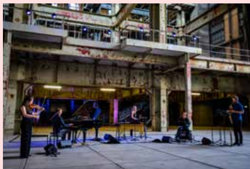
Het Haagse ensemble Kluster 5