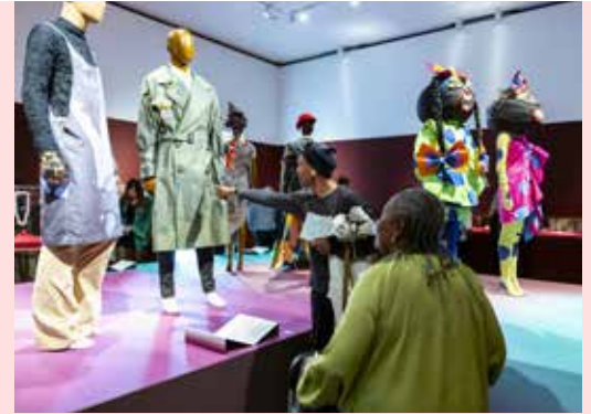
In de expositie Tussen grenzen . foto Eva Broekema

K unst kijken in één van de mooist gelegen museumgebouwen van Nederland. Dát kan in Museum Arnhem. De gratis toegankelijke beeldentuin is een fijne plek om te verblijven. Ook zonder museumticket kun je hier naar de beeldencollectie kijken, iets drinken met uitzicht op de Rijn of een potje pingpongen.