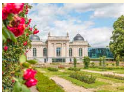
La Boverie, Ville de Liège

In de prille jaren zeventig werkte Viola samen met die andere grote videopionier, Nam June Paik; met zijn tweeën zetten ze de regels van televisie en cinema op hun kop. Viola vond een nieuwe grammatica uit voor bewegende beeld, met een fascinerende schoonheid en bezieling door een diepe spirituele drijfkracht. Zijn nieuwe beeldtaal stond in schril contrast met de Hollywood-regels en het traditionele format van documentaires en tv-entertainment.