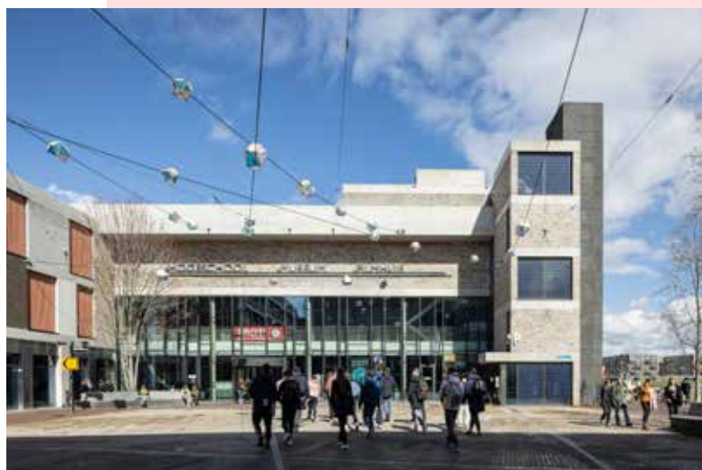
De expositie BODYTALK is in locatie Ligne te zien.

Het Museum voor Hedendaagse Kunst De Domijnen en het Museum voor Archeologie en Historie in Sittard gaan verder als één complementair museum onder de naam Het Nieuwe Domein. Het museum doorkruist op radicale wijze hedendaagse kunst en erfgoed, en biedt een frisse blik waarin verleden, heden en toekomst op verhelderende wijze samenkomen.