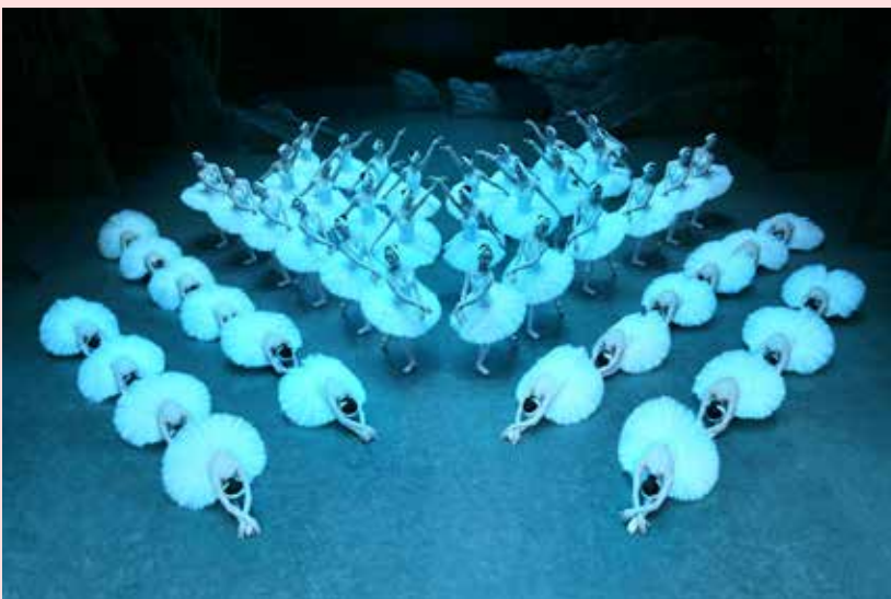
Shanghai Ballet, Het Grootste Zwanenmeer ter Wereld . foto Stardust

Het iconische ballet van Tsjaikovski met zijn tijdloze verhaal over goed en kwaad spreekt nog steeds tot de verbeelding. De ballerina's vormen een betoverend geheel; het stuk laat zien dat China op het gebied van het klassieke ballet tot de wereldtop behoort en dat het Shanghai Ballet vleugels heeft gekregen.