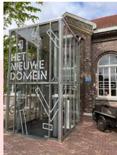
Het Nieuwe Domein, locatie Kapittelstraat.