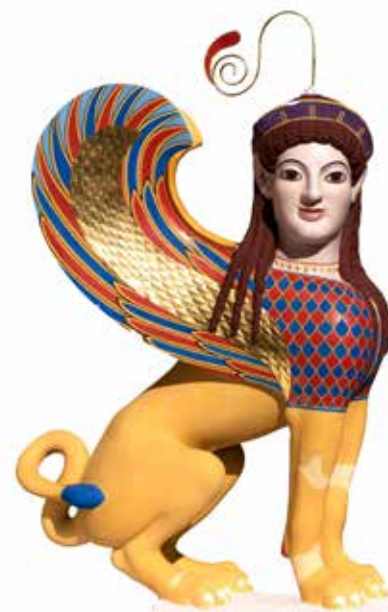
Reconstructie in kleur van een beeld van een sfinx (Attica, Griekenland, ca. 530 V.Chr.)