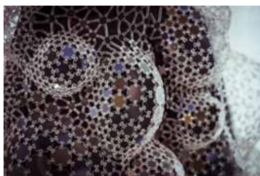
Iris van Herpen, Lucid Look 2 . foto Morgan O'Donovan

De textiele installaties in Is it alive? zijn ontstaan uit een fascinatie voor natuurlijke processen. Hoe komt iets tot leven? Wanneer ervaren we iets als 'levend'? De tentoonstelling geeft ook inzicht in het onderzoek van kunstenaars en ontwerpers die technologie gebruiken om processen en bewegingen uit de natuur te reproduceren. Kunstenaars maken gebruik van de typische eigenschappen van textiel, zoals zachtheid, bijzondere structuren en flexibiliteit, en passen die toe in innovatieve installaties.