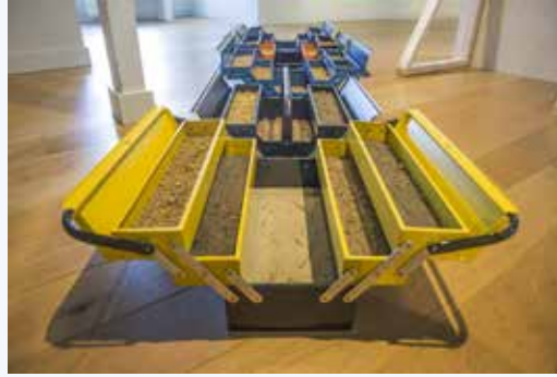
In de expositie The Animal Farmacy .

Museum Jan Cunen, gehuisvest in de historische Villa Constance, straalt als een eigenzinnig cultureel toevluchtsoord in Oss. Het zoekt met een collectie van 4800 kunstwerken en erfgoedstukken voortdurend de dialoog tussen verleden en heden. Bekende namen zoals Mesdag en Israëls worden vergezeld door eigentijdse kunstenaars, terwijl wisselende tentoonstellingen een levendig samenspel van perspectieven vormen.