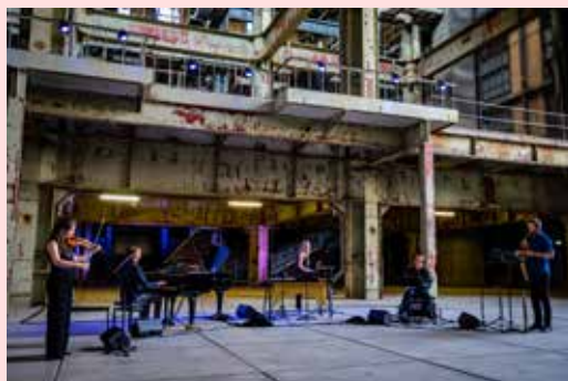
Het Haagse ensemble Kluster 5