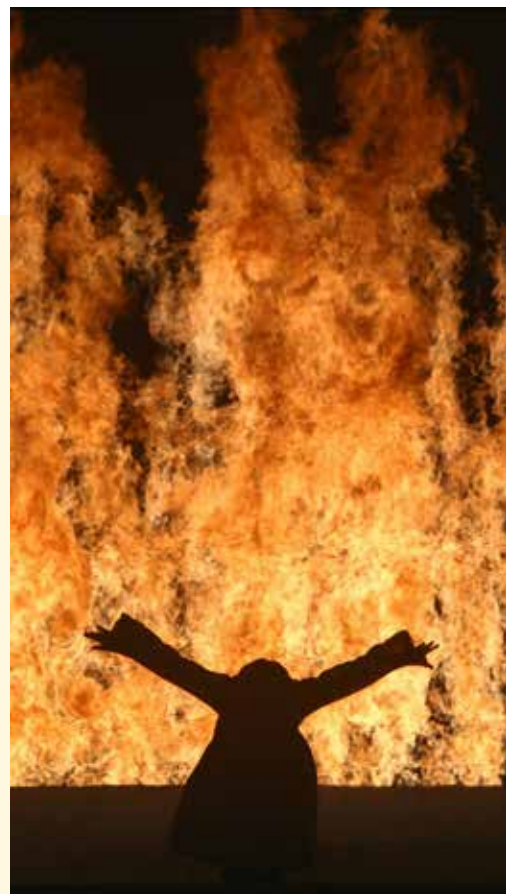
Bill Viola, Fire Woman , 2005, video/sound installation. foto Kira Perov © Bill Viola Studio

Het gebouw waar nu Museum La Boverie zit was in 1905 een van de blikvangers van de Wereldtentoonstelling in Luik. Het museum dankt zijn naam aan het aan de Maas gelegen Parc de la Boverie. In 2016 werd het neoklassieke gebouw opgeknapt en uitgebreid met een volledig beglaasd paviljoen. Het museum staat symbool van de metamorfose van Luik in de laatste tien jaar.