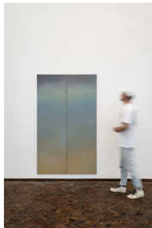
Werk van Caja Bogers.