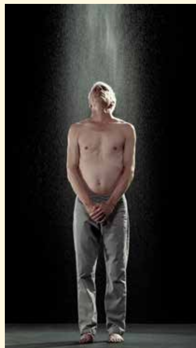
Bill Viola, Inverted Birth 2014, video/sound installation. foto Kira Perov © Bill Viola Studio