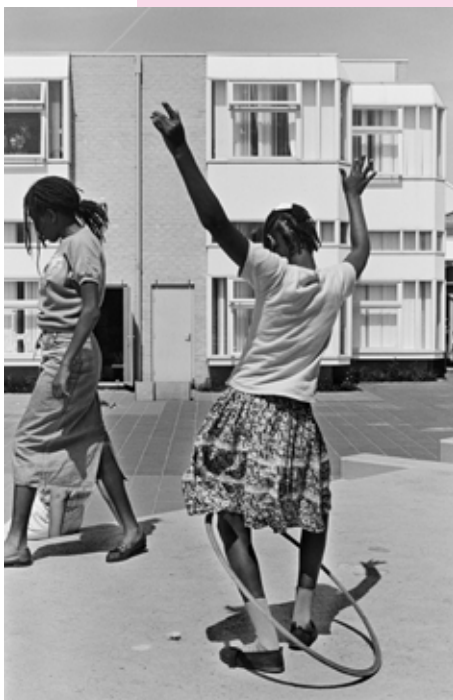
Amsterdam, 1988

Ad van Denderen: Onderweg . Van 30 september t/m 28 januari in het Nederlands Fotomuseum in Rotterdam. advandenderen.nl