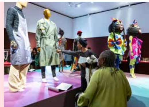
In de expositie Tussen grenzen .

K unst kijken in één van de mooist gelegen museumgebouwen van Nederland. Dát kan in Museum Arnhem. De gratis toegankelijke beeldentuin is een fijne plek om te verblijven. Ook zonder museumticket kun je hier naar de beeldencollectie kijken, iets drinken met uitzicht op de Rijn of een potje pingpongen.