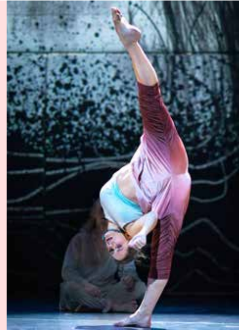
Impressie uit Message In A Bottle .