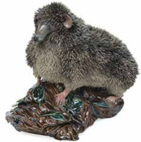
Carolein Smit, Grote Egel (2022)

Nicolas Dings werkt in het grensgebied tussen officiële kunst en volkskunst. Daarin zijn vaak de grote en kleine tegenstellingen te vinden tussen banaliteit en verhevenheid, schoonheid en lelijkheid, goed en kwaad. Het is een beeldtaal die cultureel en politiek bepaald is, en nog steeds van waarde blijkt. Zo ontstaat een 'luchtbrug' van de renaissance naar de actualiteit. Waarbij