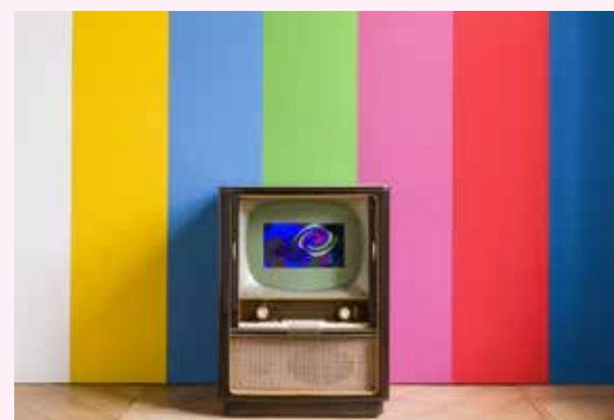
Nam June Paik, I Never Read Wittgenstein ( I Never Understood Wittgenstein), 1997