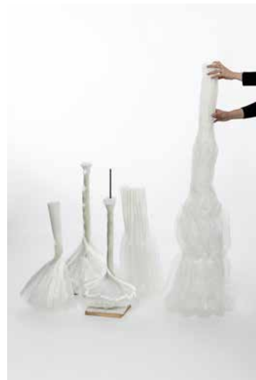
Materiaalonderzoek I am Storm van DRIFT in het TextielLab.