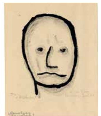
Eeltje de Vries, Der Dictator , 1967

Oda-park is een centrum voor hedendaagse kunst in Venray dat mensen in contact brengt met kunst, natuur en met elkaar; (beelden)park en paviljoen fungeren daarbij als speel- en proeftuin voor nieuwe ideeën. Het Venrays Museum is een gemeentelijk cultuurhistorisch museum. Bij de militaire begraafplaats in Ysselseyn liggen 31.714 gesneuvelde Duitsers begraven.